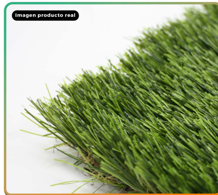
Imagen producto real