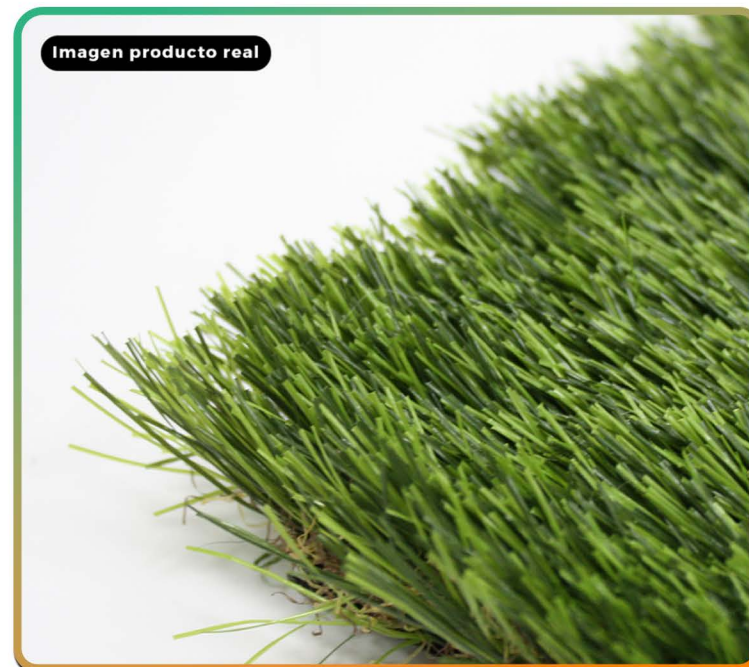
Imagen producto real